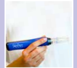
Micro needling met de Skinpen

Wil jij een behandeling boeken? Neem dan contact met ons op.